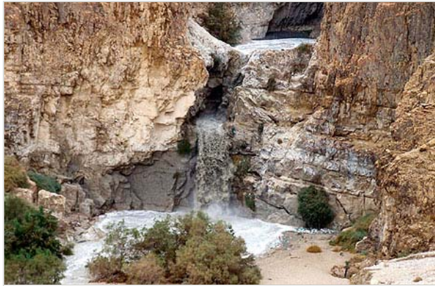
מפל קדרון. ריח רע ומצבורי אשפה למורדות הנחל

בעבר נבנה אמנם צינור ביוב גדול בחלקו הצפון מערבי של הערוץ אבל הוא מוביל את מי הביוב רק עד לכפר עובדייה, שם נבנה מתקן טיהור קטן, המכשיר מים למטעי התמרים של יישובי הבקעה. אולם אין בכך כדי לתקן את ההזנחה והזיהום שמשפיעים על הסביבה והאוכלוסייה המתגוררת בקרבת הקדרון.